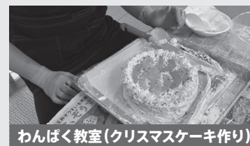
わんぱく教室(クリスマスケーキ作り)