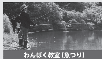
わんぱく教室(魚釣り)